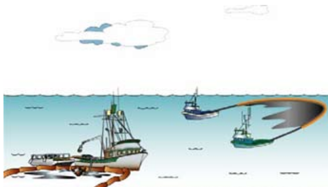
Рисунок 2. Типовая надводная система механической ликвидации нефтяных разливов

На рисунках 2, 3 и 4 показаны типовые элементы трех методов ликвидации нефтяных разливов, о которых говорилось выше. Все три метода требуют постоянного слежения за нефтяным разливом для определения места разлива, его размера и состояния разлитой нефти, с тем чтобы