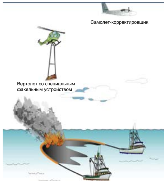
Рисунок 4. Типовая надводная система сжигания нефти на месте нефтяных разливов

выбрать и применить соответствующее оборудование и тактику ликвидации нефтяного разлива. Все три метода также требуют материально-технического обеспечения для переброски оборудования и обученного персонала к месту нефтяного разлива, развертывания оборудования и последующей очистки оборудования от загрязнения после завершения операции по ликвидации разлива. Участники операции по ликвидации нефтяного разлива должны иметь возможность безопасного доступа в зону разлива для разворачивания оборудования. Организация доступа в зону нефтяного разлива часто представляет собой наибольшую проблему, особенно в удаленных районах.