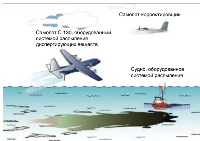
Рисунок 3. Типовая надводная диспергирующая система ликвидации нефтяных разливов