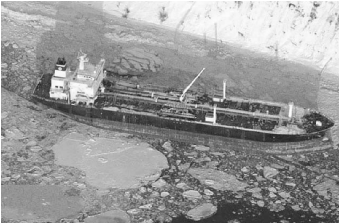
Нефтяной танкер Seabulk Pride на мели к северу от Никиски в заливе Кука, штат Аляска, США, февраль 2006 года.

Точная оценка возможностей и ограничений системы ликвидации разливов нефти необходима для прогнозирования условий, при которых такие ответные меры могут быть эффективными или неэффективными. Как только такие пределы определены, они должны учитываться на самом раннем этапе процесса планирования для того, чтобы начать понимать взаимосвязь между рисками разлива нефти и технической осуществимостью мер по его ликвидации. Еще один инструмент для принятия решений – комплексный анализ экологических преимуществ (NEBA), (в России «Анализ суммарной экологической выгоды» – АСЭВ – Прим. ред. ), который применяется для оценки потенциальных экологических рисков и преимуществ различных методов ликвидации разлива нефти – не может использоваться без тщательного анализа потенциальной эффективности различных систем ликвидации разливов нефти применительно к условиям различных арктических регионов.